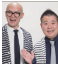
北海道札幌市出身の若手 人気芸人「しろっぶ」がバス ツアーを盛り上げてくれます!