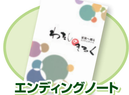
エンディングノート