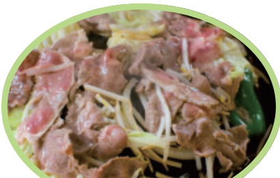
ジンギスカン+野菜セット